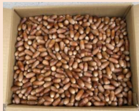
2025年度の報告 (2026年1月まで) 総計18トン

当会ではこれまで、鹿苑で保護されている鹿の飼料の一部として、全国の皆さまからドングリのご支援をいただいております。