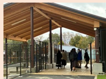
鹿苑公開展示「鹿の道」の様子