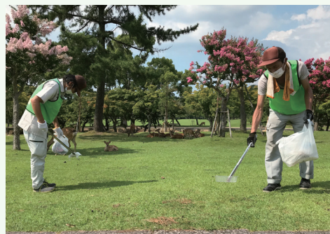
▲奈良公園内の清掃活動風景

奈良公園内で活動していると、色々な方から声をかけてもらう事も増えました。先日は遠方の学生様から「鹿が間違っって食べてしまったプラスチック