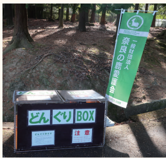
▲どんぐりBOX ◀2023年も秋から冬も設置予定です。