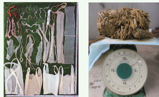
▲鹿の胃内から見つかったプラスチックゴミ

今後、より多くの方々へ奈良公園の鹿たちの現状や清掃・啓発活動について知っていただくよう取り組みを進めていきたいと思えます。【美鹿パトロール隊スタッフ一同】