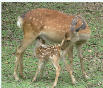
▲特別公開 子鹿公開

6月に期間限定で、出産期に鹿苑で保護している母子鹿の特別公開「子鹿公開」赤ちゃん鹿大集合！を今年も開催予定です！