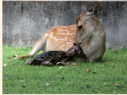
▲鹿苑内で出産したお母さん鹿

奈良公園内の全てのお母さん鹿を保護しているわけではなく、奈良公園内で出産・子育てをするお母さん鹿もいます。子鹿は小さく、可愛らしいですが接し方を間違えると鹿と人とのトラブルに繋がります。奈良公園内で子鹿を見かけた時は、近寄らずにそっと離れてください。