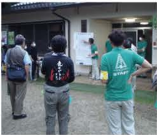
▲頭数調査の様子 (協力者ミーティング)

調査は、早朝に行い、13のコースに分かれて全てのコースで協力して連携をとりながらカウントしていきます。今年の調査では、子鹿の頭数が減少していますが、調査日前後に雨が続き