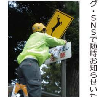
▲鹿の警戒標識、点検、清掃の様子

中止のお知らせ 古都奈良の秋を彩る伝統行事「古式鹿の角きり」の開催について検討してまいりましたが、皆様の安全のため、新型コロナウイルス感染症予防対策をとりつつの開催は難しいとの判断にいたしました。 そのため、昨年に続き今年も「古式鹿の角きり」は中止とさせていただきます。ことになりました。 楽しみにしていただけいていた皆様には、大変ご迷惑をおかけいたします。このような特殊な状況が続いておりますので、ご理解いただきますようお願いいたします。