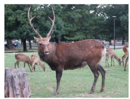
▲秋から冬のオスシカは危険です!

奈良公園に生息する鹿たちは野生動物です。秋頃は、オスシカにとって子孫を残すためのとても大切な時期です。この時期(発情期)のオスシカは、たいへん気が荒く、オスシカ同士で角の突き合わせをしたり、なわばりを持ちメスシカの群れを囲い込むようになります。